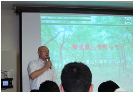
⑦出前町長室（東京農業大学にて6月）