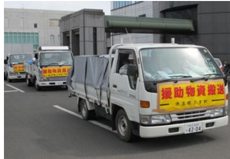
①東日本大震災（3月12日）

①東日本大震災復興支援 三芳町では、すみやかに「警戒本部」を設置。町内の災害時の相互応援協定の関係にある茨城県常陸大宮市に緊急物資を搬送。職員の手