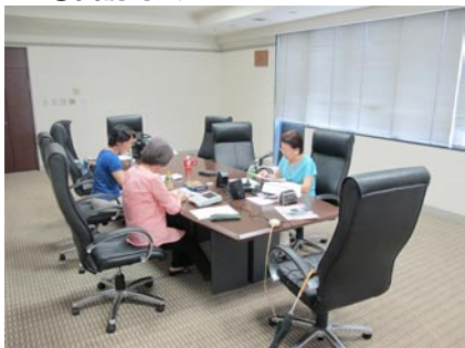
⑧市民活動支援センター（旧町長室）

の優先課題一番の給食センターとの併設で財政的な負担も軽減し、両施設建設可能に。まちづくり懇話会、利用者の集い、埼玉県で初めての「意見交換型世論調査」も開催し、広く住民の皆さまの声を聞くことができました。