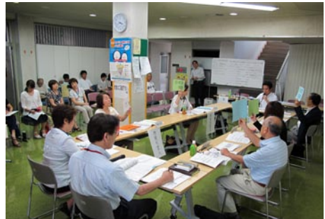
③三芳版事業仕分け（7月）