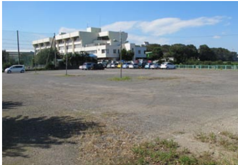
⑤給食センター・中央公民館建設予定地

⑤給食センター・中央公民館併設で始動 長年、懸案となっていた中央公民館は、老朽化が進み安全確保のため閉館へ。一方で、建設