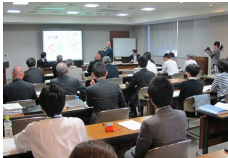
②政策研究所設置；中間発表（10月）