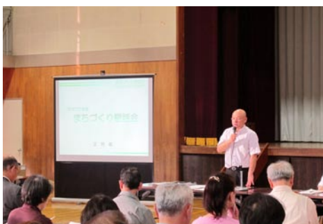
⑥まちづくり懇話会（6月）