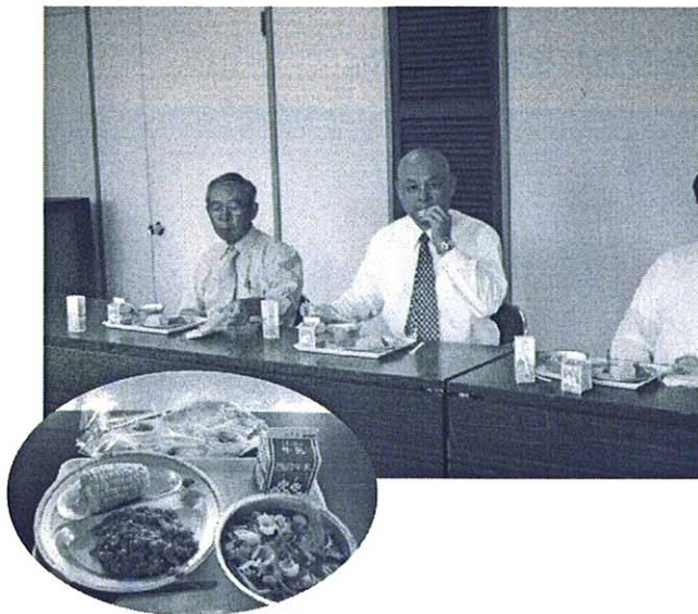
給食センターにてカレーの試食

7月20日、第2回臨時議会。議案は、水槽付消防ポンプ自動車（上福岡消防署）、小型水槽付消防ポンプ自動車（富士見消防署みずほ台分署）の購入契約の締結について。いずれも耐用年数と排ガス規制による車輛の計画的更新によるものです。