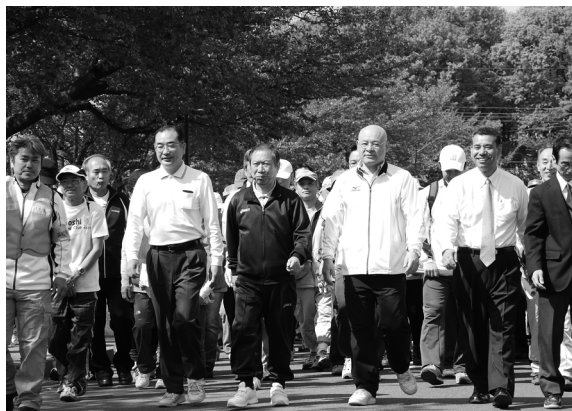
ふるさとウォーキング(4月29日)