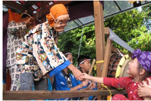
「ひよつとこ」の舞子

上富小学校の郷土伝承ク ラブ。小学校4年〜6年生 22名が、毎週木曜日、草鞋 を作ったり、昔の遊びにチャ レンジしたり、お囃子を学 んでいます。 クラブができて20年経ち ますが、今では上富の夏祭 り（天王様）、お地藏様や 年によってはみよし祭 りや上富祭りでもお囃 子を披露しています。 太鼓や鉦 かね はもとよ り、獅子、おかめ、ひよつ とこ、狐など舞子も大 人顔負けの迫真の演技 です。 指導は定期的に地元 の上富囃子保存会があ たっています。 参加されている子ど も達も緊張するけれ ど、お囃子を通して 日本のお祭りが好きに なったと嬉しそうに話 してくれました。日本 の伝統、文化がこうし て受け継がれている姿 に安心を覚えます。