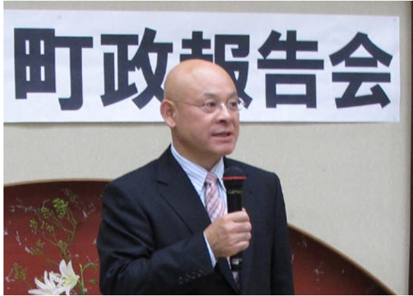
町政報告会でのご挨拶

ブログ： http://pikaichino.exblog.jp/ Tel 049-259-2228 討議資料 No. 44 町政報告会 21年7月21日号林いさお後援会