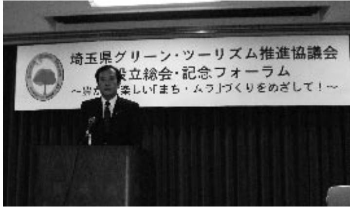
協議会の設立に期待を寄せる上田埼玉県知事

ブログ： http://pikaichino.exblog.jp/ Tel 049-259-2228 共に!! 討議資料 No. 29 グリーン・ツーリズム 20年10月21日号林いさお後援会