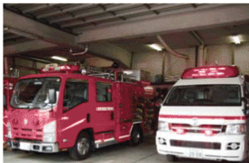
梯子車と救急富士見1号車