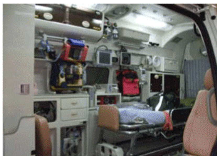
救急富士見第1号の内部

と違い、進行方向に対して車輛中央から横置きにし、左右から取り出しを可能にしました。