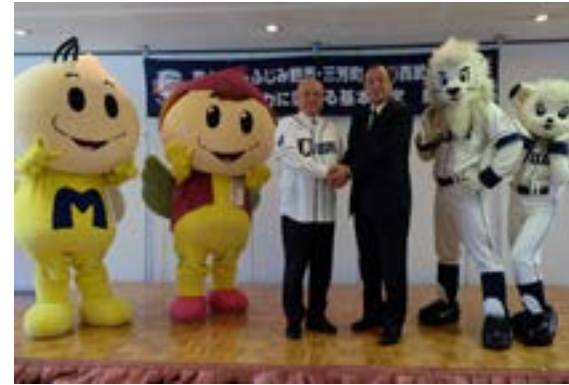
居郷肇西武ライオンズ代表取締役社長と