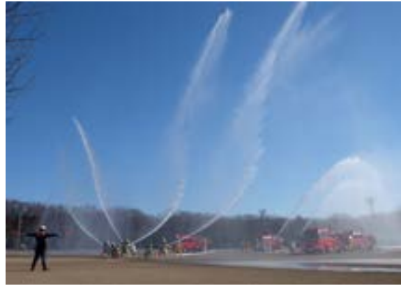
消防署・消防団による放水訓練

平成28年三芳町成人式が、1月11日、コピスみよしで開催されました。成人者数は、男性212人、女性195人の合計407人です。自らの夢や目標に向かって懸命に生き、自分らしい豊かな人生を送ってほしいと思います。心からお祝い申し上げます。