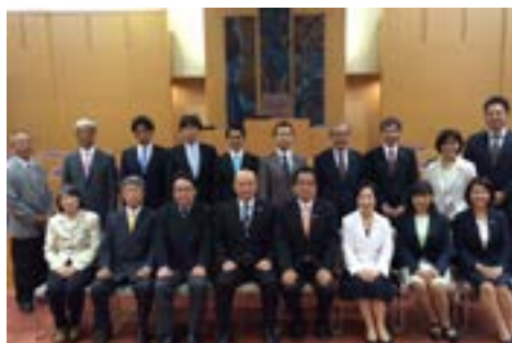
③臨時議会開会（5月12日）