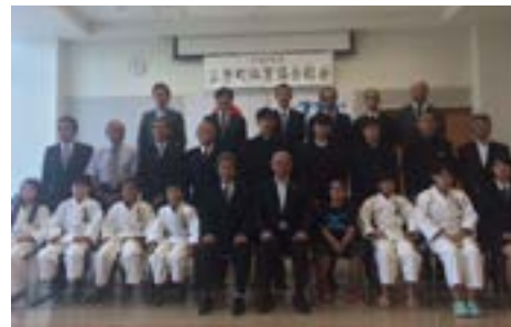
⑥表彰された皆さんと（5月17日）