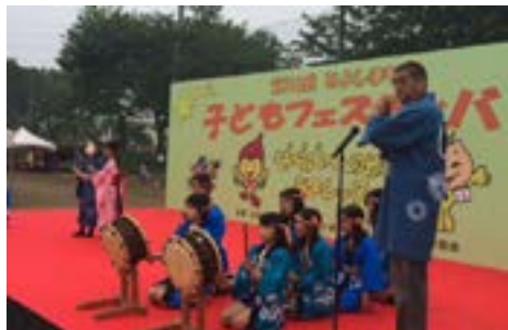
①上富小郷土芸能保存クラブ（5月9日）