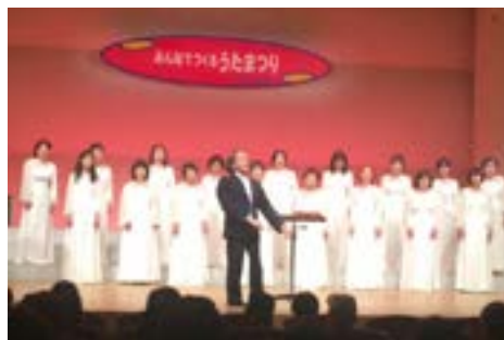
⑤コピスみよしにて（5月16日）

新年度から「町長の事業所訪問」が「町長のまち・ひと・しごと魅力発見！！」となり、第1弾は、北永井の大王パッケージ（株）を訪問しました。段ボール、美粧段ボール、シール・ラベル等の開発・製造を行っています。