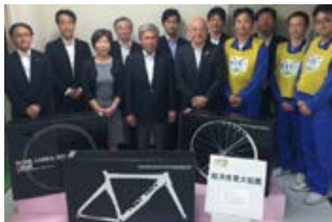
④大王パッケージ（株）訪問（5月15日）