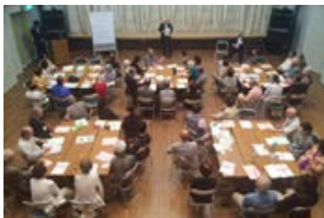
⑧竹間沢公民館にて（5月21日）