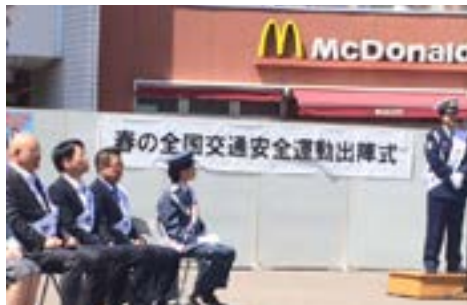
②上福岡ココネ広場にて（5月11日）