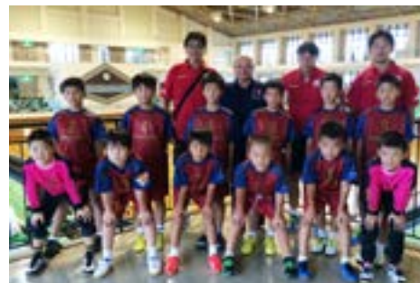
⑦ジュニアハンドボール大会（8月8日）