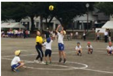
③ドッジボール大会（7月19日）