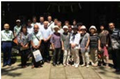
④三富新田視察（7月27日）