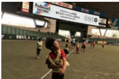
⑧フライドリーム埼玉（8月11日）