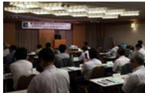
⑥トップセミナー（7月31日）