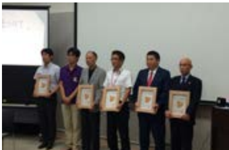
②あいサポート団体に（7月14日）