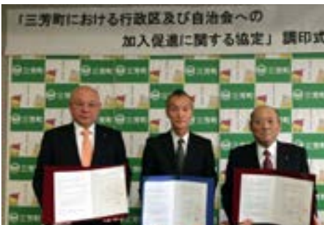
⑤行政区加入促進協力調印式 (4月22日)