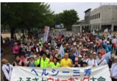
⑧ふるさとウォーキング (4月29日)