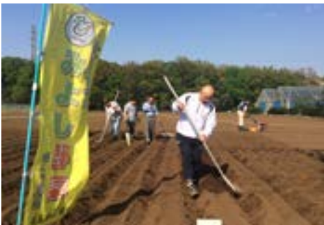
⑥そば栽培体験 (4月24日)