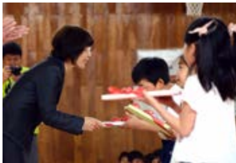
③ブックリスト贈呈 (4月16日)